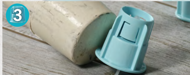
Leichtes Abschlagen der Drehknöpfe nach Aushärtung des Klebers