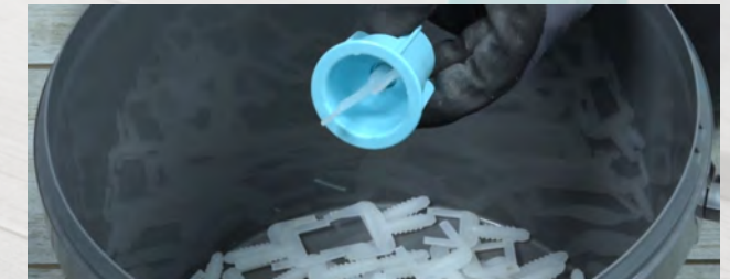
Durch Druck auf die Schnellarretierung fällt der Gewindestaschenrest heraus