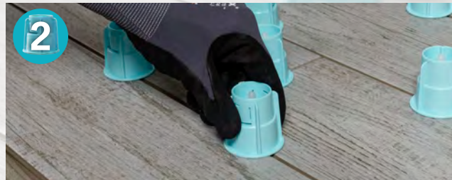
Drehknopf mit intelligentem Raster aufstecken und mit ca. 1-2 Umdrehungen kräftig fixieren