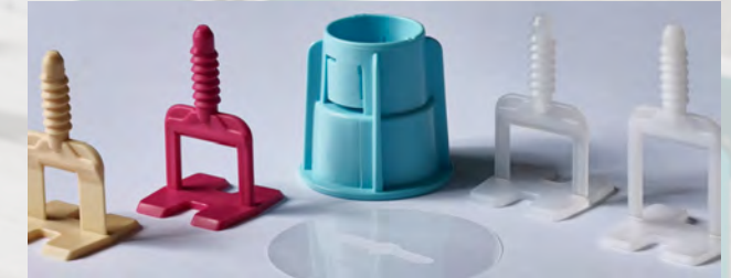
Das ARDEX-Nivelliersystem im Überblick