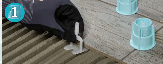
Einsetzen der Gewindelaschen