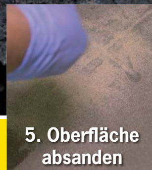
5. Oberfläche absanden