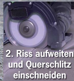
2. Riss aufweiten und Querschlitz einschneiden