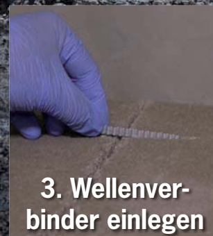
3. Wellenverbinder einlegen