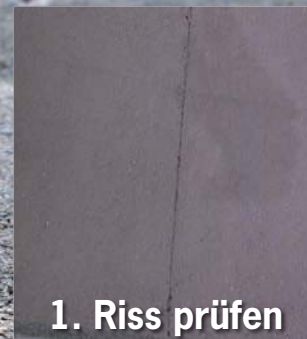
1. Riss prüfen