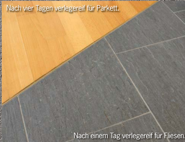
Nach vier Tagen verlegereif für Parkett.

Insbesondere bei Verzögerungen des Baufortschritts kann mit dem ARDEX A 28 Schnellestrich-Bindemittel wertvolle Zeit zurückgewonnen werden.