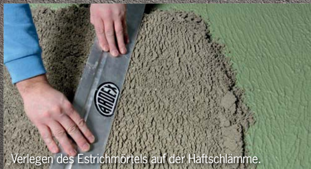
Verlegen des Estrichmörtels auf der Haftschlämme.

Erleben Sie die digitale Welt von ARDEX.