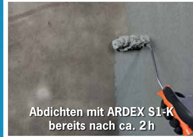
Abdichten mit ARDEX S1-K bereits nach ca. 2 h