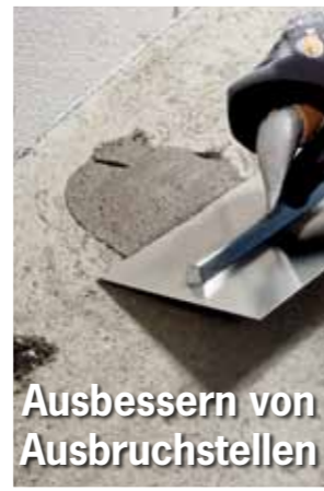
Ausbessern von Ausbruchstellen