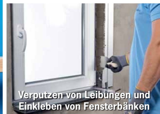
Verputzen von Leibungen und Einkleben von Fensterbänken