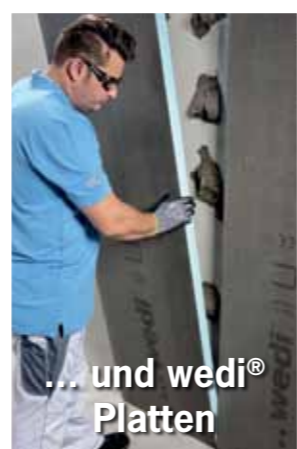
... und wedi® Platten