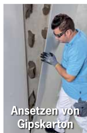
Ansetzen von Gipskarton