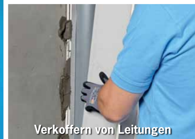
Verkoffern von Leitungen