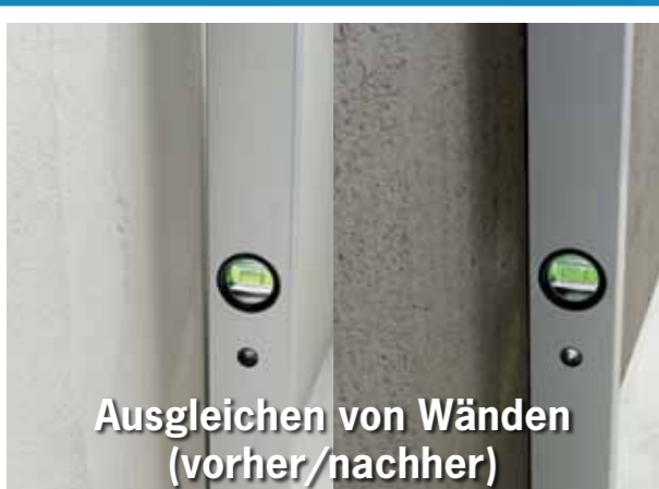
Ausgleichen von Wänden (vorher/nachher)