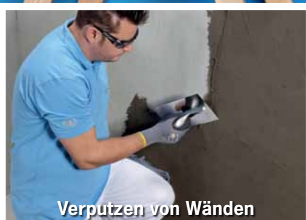
Verputzen von Wänden