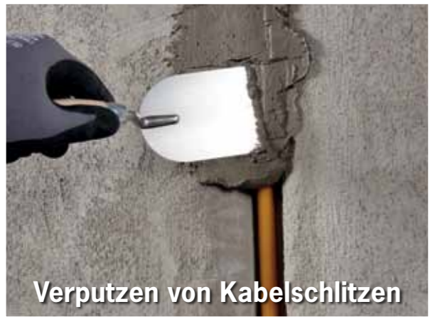
Verputzen von Kabelschlitzen