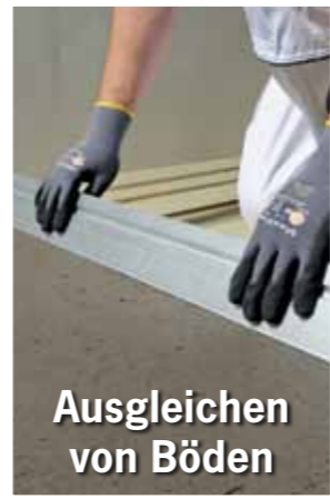
Ausgleichen von Böden