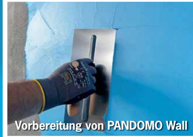
Vorbereitung von PANDOMO Wall