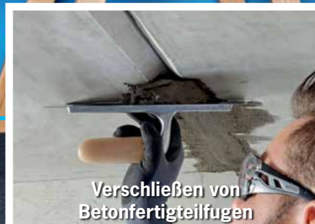
Verschließen von Betonfertigteiltugen